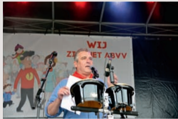
Toespraak van de voorzitter