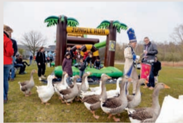
De Ganzenparade trekt voorbij de jungle