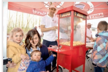
Popcorn à volonté