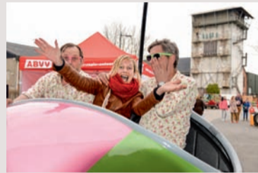
FaceBob baant de weg