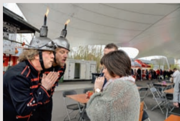
De kleinste cocktailbar ter wereld