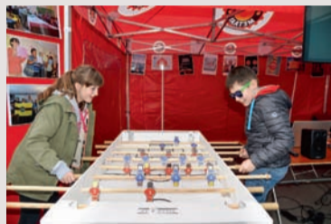
Sjotten als de groten