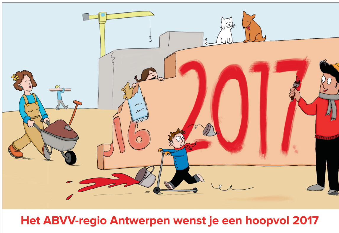
Het ABVV-regio Antwerpen wenst je een hoopvol 2017