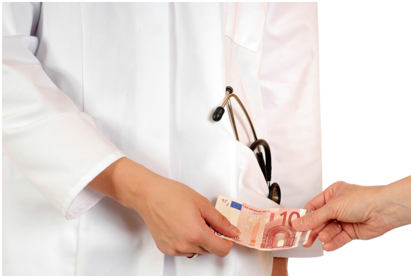
■ Vanaf 1 januari 2017 moet je iets meer remgeld betalen voordat je het plafond bereikt en je ziekenfonds het verschil terugbetaalt

Maagzuurremmers in de hoogste dosering in grote verpakkingen van meer dan 60 tabletten worden niet meer terugbetaald, maar de maagzuurremmers in verpakkingen van maximum 60 tabletten of in lagere doseringen worden nog steeds terugbetaald.